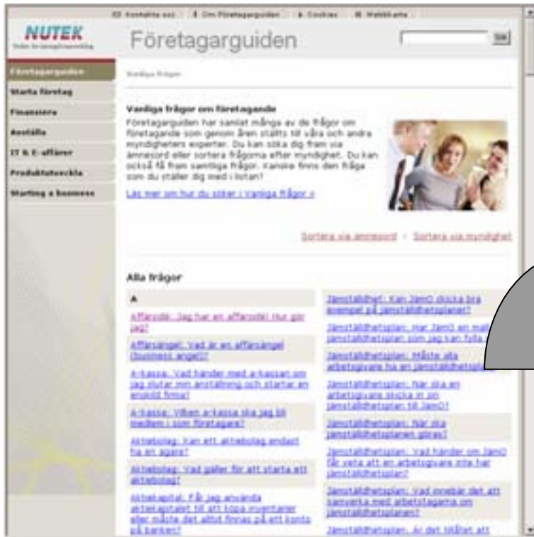
Vanliga frågor på Företagarguiden