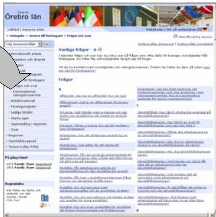
Vanliga frågor på orebrolan.se